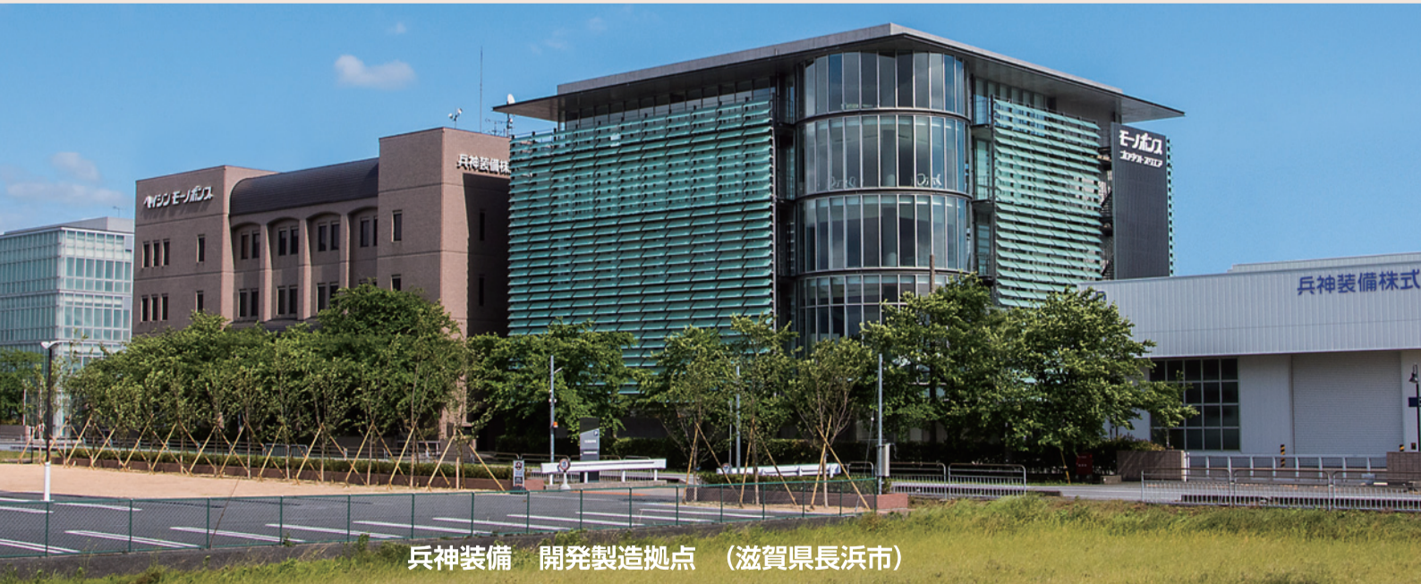
兵神装備 開発製造拠点（滋賀県長浜市）