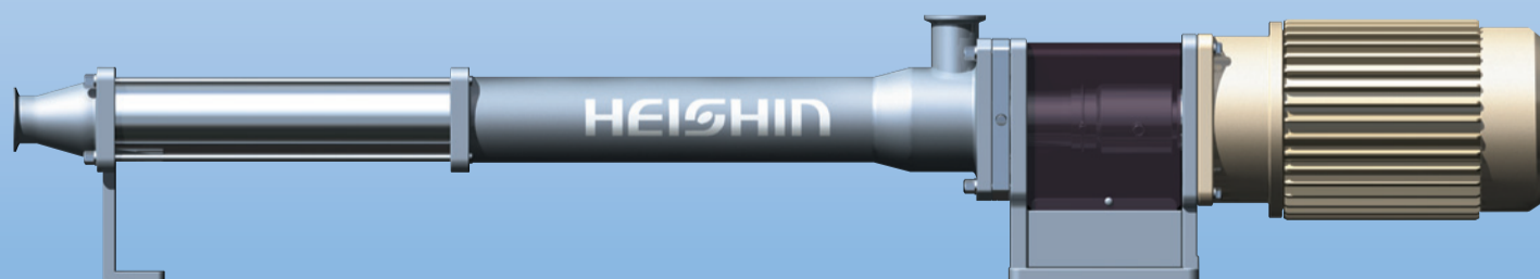
兵神装備の主要製品であるモノポンプ